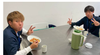
職員も美味しいカレーに大満足♪