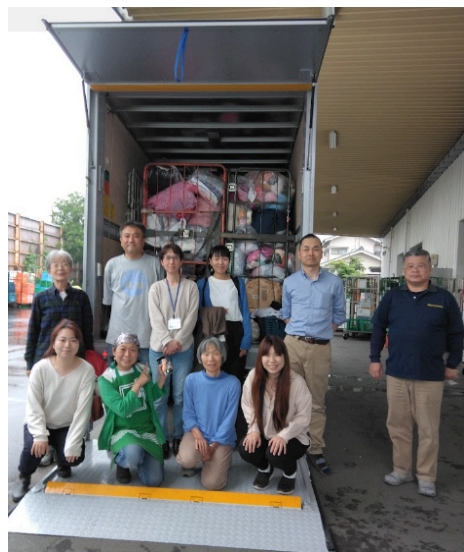
便利な昇降台付トラックで作業はガンと楽に！

パキスタンの義務教育は5歳から16歳ですが、カラチ市では教員が足りずに学校として機能していない公立学校が多く、小さなうちから働いて家計を助けている子どもが多くいるそうです。JFSAは、そのような子どもたちのための無料で学べる学校、アル・カイルアカデミーの建設や運営に協力しています。現在、8つの学校に6000人を超える生徒が在籍しています。親世代の方たちも、学校通学経験がないと学校で学ぶ大切さが分かりません。そのような親たちに学校の重要さを理解してもらう必要があるため、学校は家庭訪問や集会を開くなどしています。また教育を受ける機会を得られない環境の悪いスラムに分校を建てることもあるそうです（親の目の届く