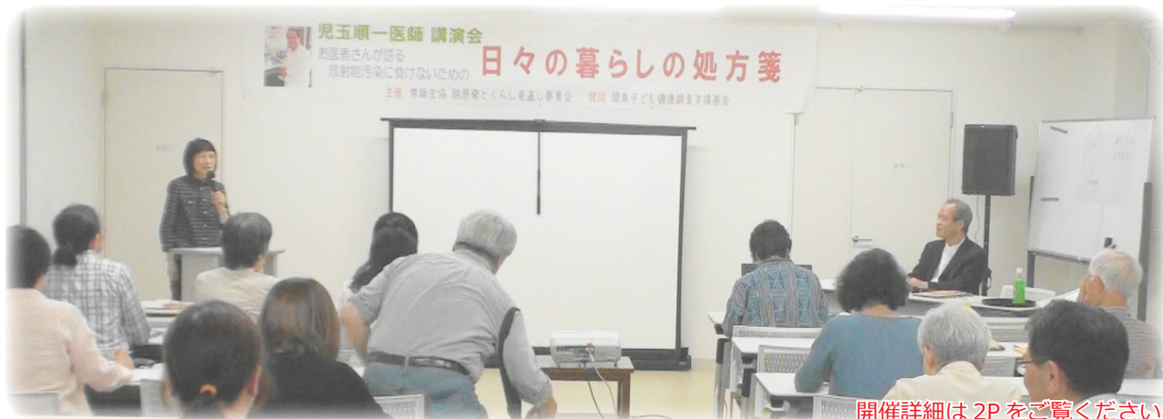
開催詳細は 2P をご覧ください。