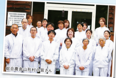
総合農舎山形村の皆さん