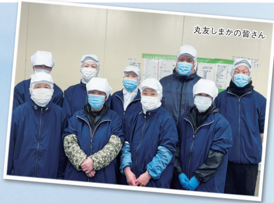
丸友しまかの皆さん