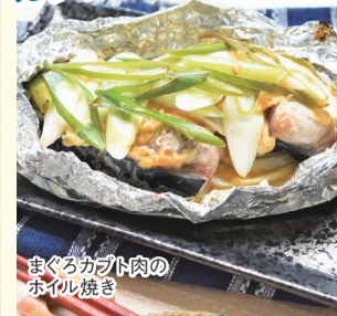
まぐろカブト肉のホイル焼き

107 凍 マストミ(徳島県・徳島市) 30日 まぐろカブト肉切身 300g 398円(税込430円) 通常税込451円 DHAが豊富なめばちまぐろ頭部の肉です。脂分が多く、煮ても焼いても軟らかいです。*台湾船籍の船で漁獲めばちまぐろ(太平洋)