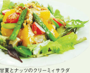
甘夏とナッツのクリーミーサラダ