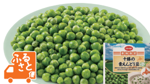
日本生活協同組合連合会

266 CO十勝の青えんどう豆200g 北海道十勝地方で収穫された緑鮮やかな青えんどう豆(グリーンピース)を急速凍結。サラダや豆ご飯などに。