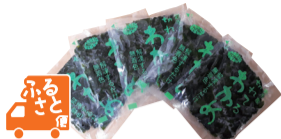
コタニ(岩手県・大船渡市)

267 すぐに使える生わかめ(岩手県産) 岩手県産で、3月に収穫したわかめをボイルし、使いやすい小分けにしました。解凍してそのまま使えます。