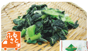
日岡商事(兵庫県・加古川市)

265 冷凍小松菜 宮崎の契約農家で栽培された小松菜を新鮮なうちに下処理。使いやすい5cmカット。幅広い料理に。