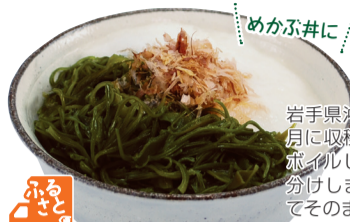
コタニ(岩手県・大船渡市)

凍 40g×5パック 390円(税込421円) わかめ(岩手県) [放] 不検出 <0.6 <0.6