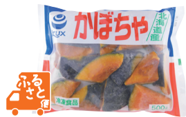
イズックス(東京都・中央区)

264 冷凍かぼちゃ 北海道産のかぼちゃ使用。しっとりとした甘いかぼちゃです。煮物やスープに。