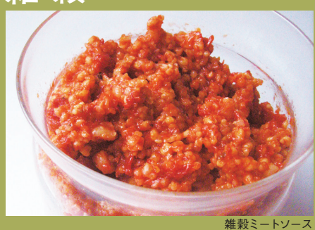
雑穀ミートソース

アマランサス・そば・キビ・はとむぎ・大麦・キノワの6種をブレンド。ミネラル、食物繊維の補給に。