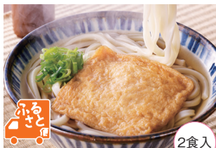
2食入 ニッキーフーズ(大阪府・大阪市)