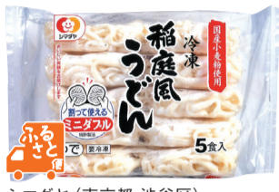
5食入 シマダヤ(東京都・渋谷区)