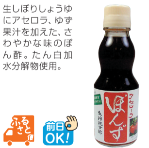
森文醸造(愛媛県・内子町)