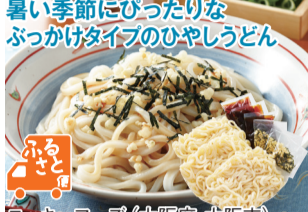
3食入 ニッキーフーズ(大阪府・大阪市)