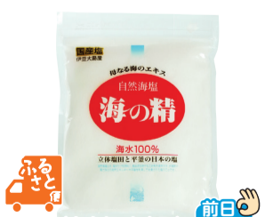
海(東京都・大島町)