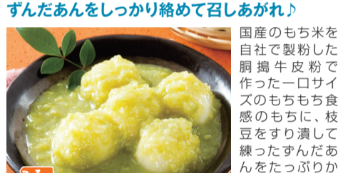
8個入 岩手阿部製粉(岩手県・花巻市)