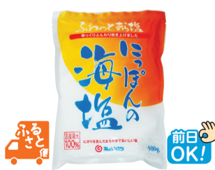
海はいのち(長崎県・南島原市)