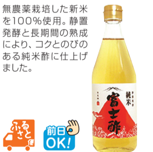
飯尾醸造(京都府・宮津市)