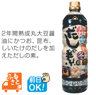
2年間熟成丸大豆醤油にかつお、昆布、しいたけのだしを加えただしの素。