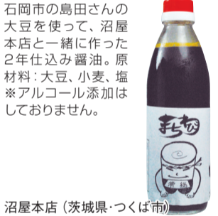
沼屋本店(茨城県・つくば市)