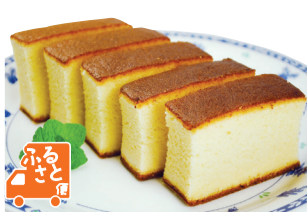
5切 ニッコー(神奈川県・大和市)