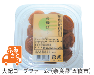
大紀コープファーム(奈良県・五條市)