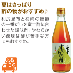
飯尾醸造(京都府・宮津市)