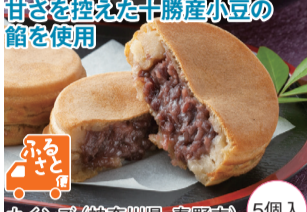
5個入 カインズ(神奈川県・秦野市)