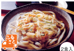
2食入 ニッキーフーズ(大阪府・大阪市)