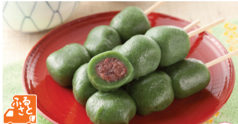
4本入 岩手阿部製粉(岩手県・花巻市)