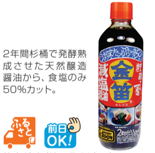
2年間杉桶で発酵熟成させた天然醸造醤油から、食塩のみ50%カット。