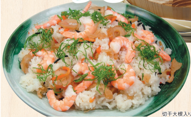
切干大根入りちらし寿司