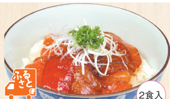
きざみうなぎと海鮮のちらし寿司

82 びんちょうまぐろ(井用) 70g×2 378円(税込408円) (通常税込430円) 山菱水産(福島県・いわき市)