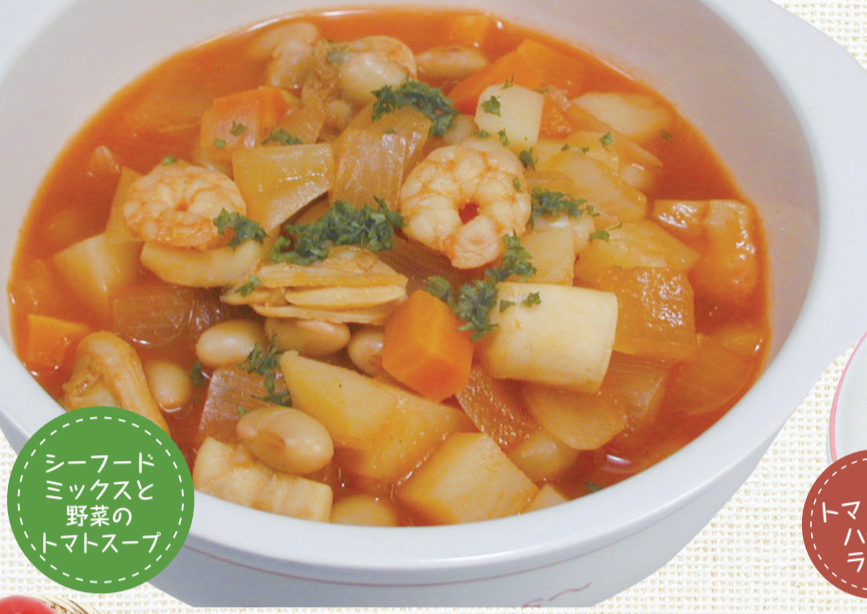
シーフードミックスと野菜のトマトスープ

いつも忙しく過ごしているお母さんの代わりにお料理を作っておあげるのはいかがでしょうか? お子さんと一緒に作るのはいかがでしょうか? トマトの旨味を味方につければ、ぐんとコクのあるひと皿が出来ます。