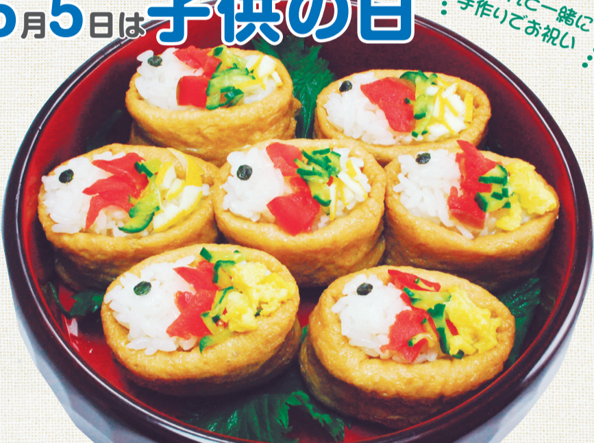
鯉のぼりいなり寿司