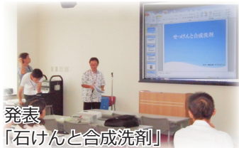
発表「石けんと合成洗剤」