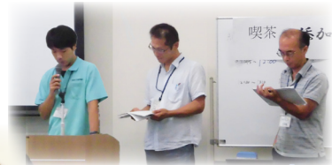
発表「ネオニコチノイド系農薬」