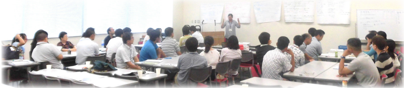
【午前の部】石けん・添加物・農薬 3グループ研究発表